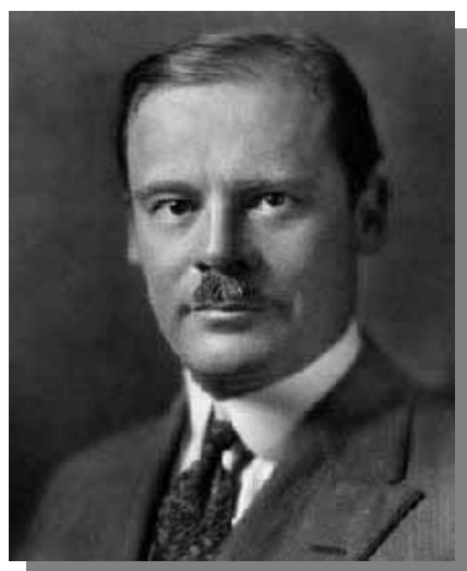
Ernest F.W. Alexanderson (1878-1975)

L'émetteur suédois SAQ situé à Grimeton sera réactivé le dimanche 1er juillet.