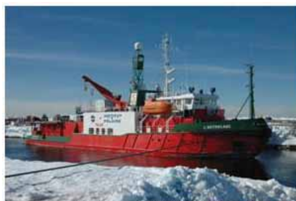
Le navire polaire français ASTROLABE en Terre Adélie