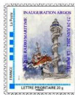
Timbre personnalisé (TP)