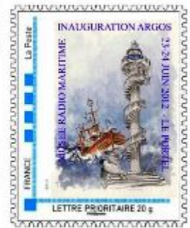
Timbre personnalisé (TP)