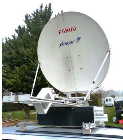
73 de Jean Claude F5BUU

Le rendez-vous annuel de "la Grande Bleue" aura lieu du 14 au 24 juin et rassemblera les passionnés d'hyperfréquences sur le pourtour méditerranéen. Les principaux préfixes activés seront EA, I, IS0, TK et bien sûr F. Pour plus de détails, voir le site :