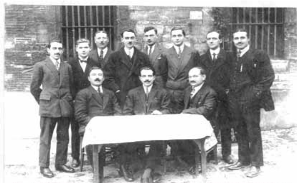
Réunion préparatoire du Radio Club de l'Aube (1922)

Le Radio Club de l'Aube F5KOB activera du 14 au 27 Septembre 2013 sur une plage horaire la plus étendue possible un indicatif spécial TM90KOB pour ses 90 ans d'existence.